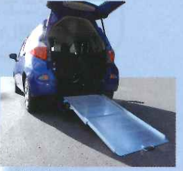
乗降が楽な福祉タクシーです。