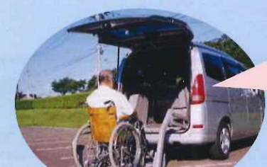
車椅子でのご利用も出来ます。